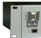
Tischmodell Table version